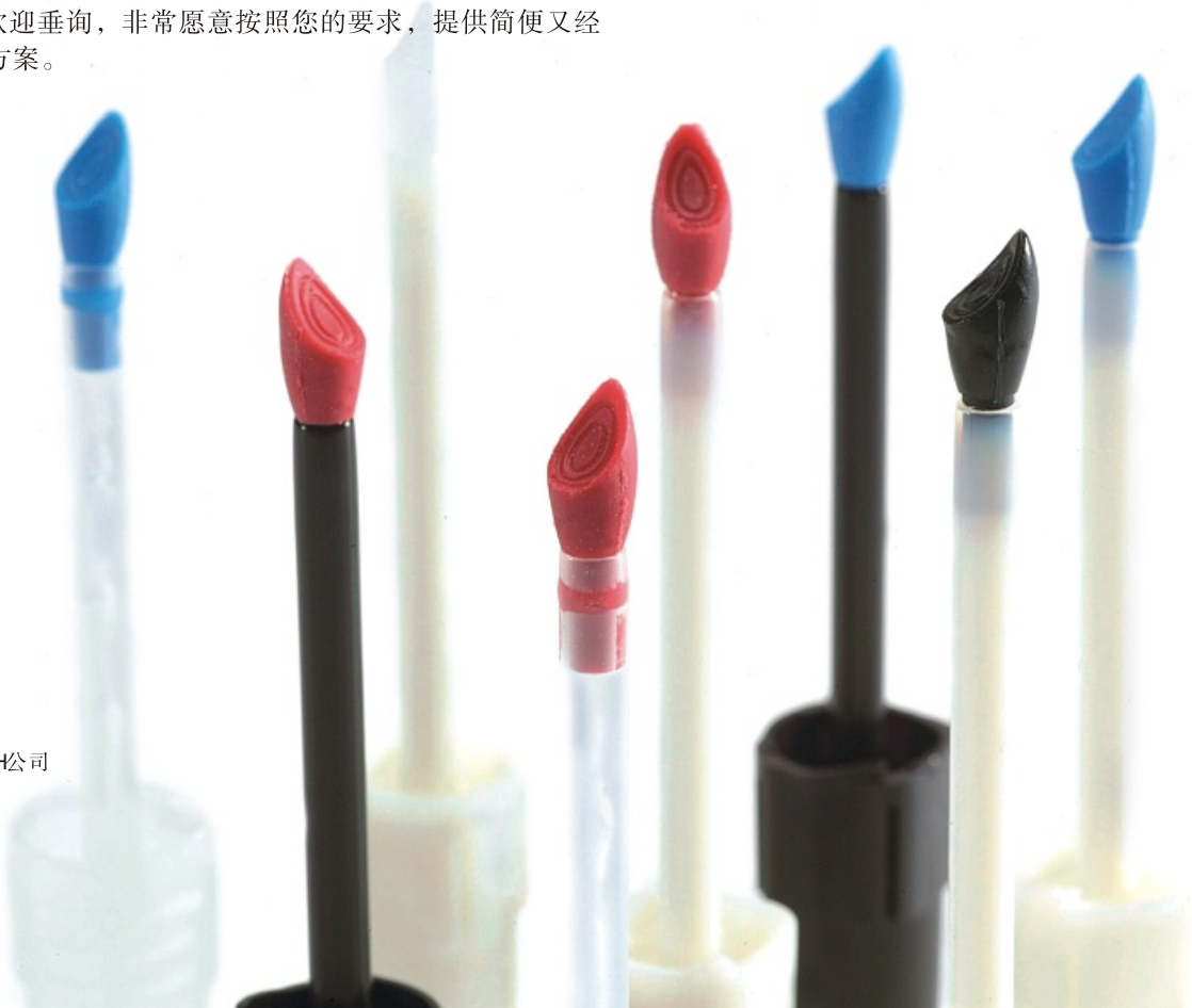
唇膏笔 GEKA BRUSH公司