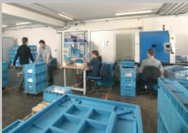
图片实例：轴形套筒 OSSBERGER公司