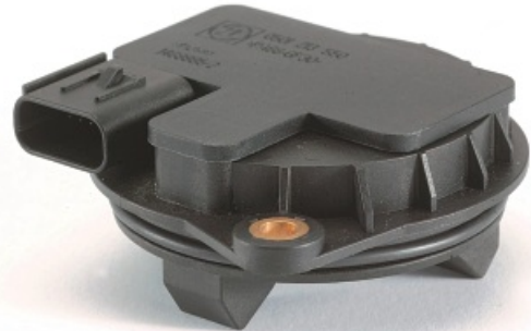
手自一体变速箱传感器。 Tyco Electronics AMP 公司